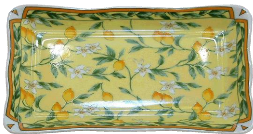
品番：38118* JAN: 4560136874532 スクエアトレイ W16/D10/H2 各本体価格¥1,100 カートン入数48

パンマット(鍋敷き) W15.5/D15.5 各本体価格¥1,600 カートン入数24