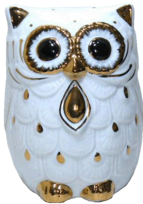
品番：37536* JAN: 4560136887679 ふくろうM W11/D11/H14 本体価格¥2,800 カートン入数36