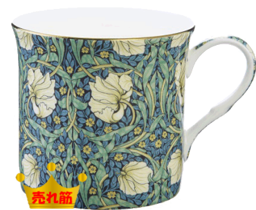
売れ筋 品番：37706 JAN: 4560136889376