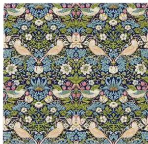
バード&ストロベリー