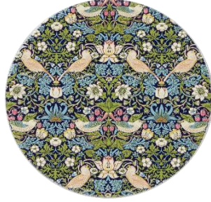
バード&ストロベリー