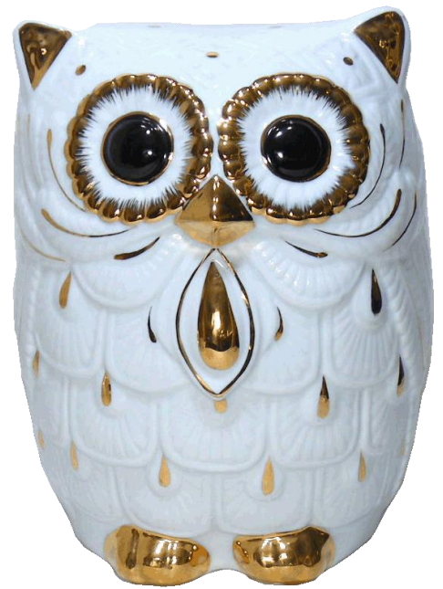
品番：37535* JAN: 4560136887662 ふくろうL W18/D17/H24 本体価格¥9,800 カートン入数6