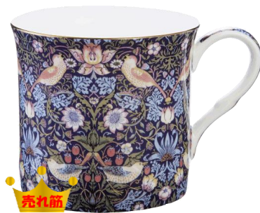
売れ筋 品番：37705 JAN: 4560136889369