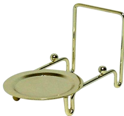
品番：99995 JAN:4562133545040 W7/D12/H7.5 本体価格¥480 カarton入数96(インナー24)