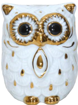
品番：37537 JAN: 4560136887686 ふくろうS W7/D6.5/H9 本体価格¥1,600 カートン入数108